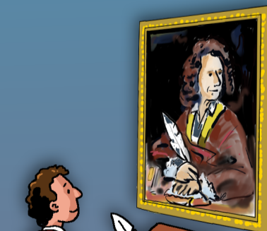
Imitations de texte