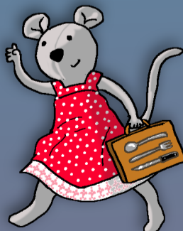
Pour les petits